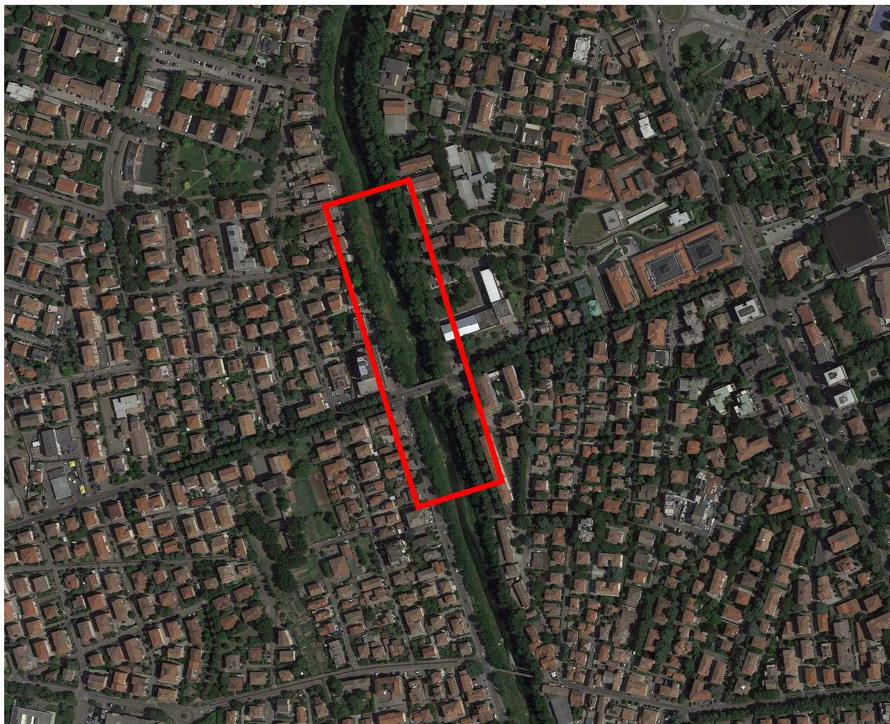
Figura 1 Individuazione della zona d'intervento lungo Torrente Crostolo nel comune di Reggio Emilia